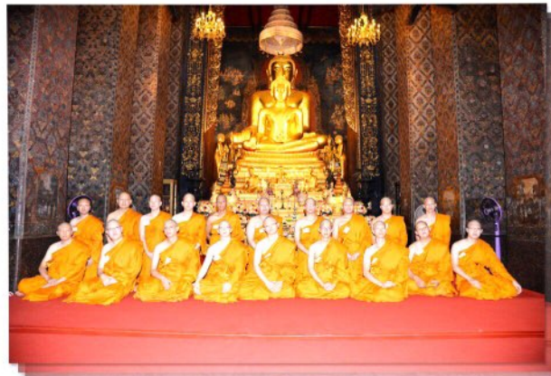
พิธีบรรพชาอุปสมบท นักเรียนแพทย์ทหาร