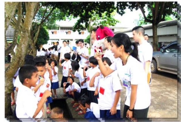
นักเรียนแพทย์ทหารชั้นคลินิก

มูลนิธิฯ ได้รับการประกาศเป็นองค์การสาธารณกุศลลำดับที่ 673 ตามประกาศของกระทรวงการคลัง เมื่อวันที่ 7 เมษายน 2535 และอาศัยอำนาจตามมาตรา 47(7)(ข) แห่งประมวลรัษฎากรซึ่งแก้ไขเพิ่มเติมโดยพระราชบัญญัติแก้ไขเพิ่มเติมประมวลรัษฎากร (ฉบับที่ 19) พ.ศ.2508 ประกาศ ณ วันที่ 13 กุมภาพันธ์ 2552