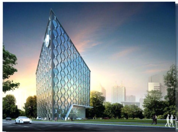
โครงการอาคารศูนย์สถานการณ้จำลองทางการแพทย์ทหาร