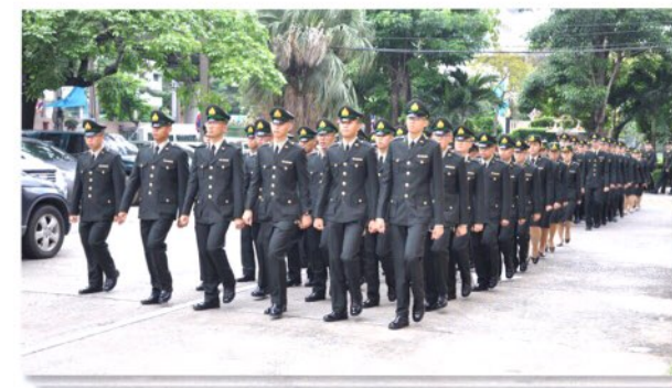
นักเรียนแพทย์ทหารชั้นปรีคลินิก