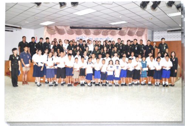
พิธีมอบทุนการศึกษาบุตรข้าราชการ วพม.

มูลนิธิฯ ได้รับการประกาศเป็นองค์การสาธารณกุศลลำดับที่ 673 ตามประกาศของกระทรวงการคลัง เมื่อวันที่ 7 เมษายน 2535 และอาศัยอำนาจตามมาตรา 47(7)(ข) แห่งประมวลรัษฎากรซึ่งแก้ไขเพิ่มเติมโดยพระราชบัญญัติแก้ไขเพิ่มเติมประมวลรัษฎากร (ฉบับที่ 19) พ.ศ.2508 ประกาศ ณ วันที่ 13 กุมภาพันธ์ 2552